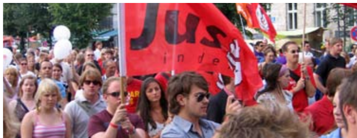
Jusos in Aktion, wir zeigen uns und verschaffen unserer Meinung Gehör. Auf der Straße und in der SPD.

Wir Jusos finden: Bildung muss für alle kostenlos sein, angefangen von der Kita bis zur Hochschule. Nur so schaffen wir es,